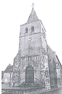
L'église Saint-André date du XV e siècle.