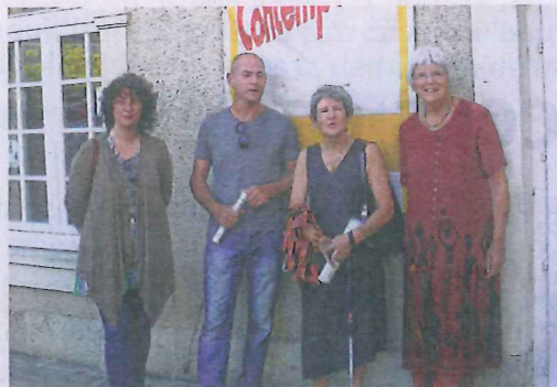
L'exposition du Mébac est à découvrir tout le mois d'août.

originaire du Blanc. Elle est sculpteur et est revenue s'installer à Pouligny-Saint-Pierre. Depuis plus de trente ans, elle se passionne pour la sculpture. Elle a découvert la stéatite, pierre tendre aux couleurs différentes, et aime travailler le bois.