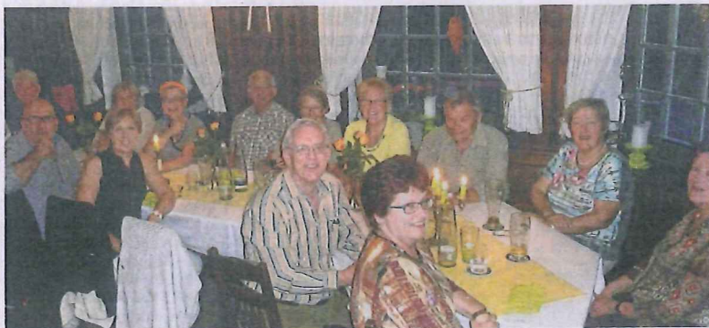
Cet échange a été des plus chaleureux entre les membres des comités.

En 2014, Azay-le-Ferron recevait les amis de Garsam-Inn. Cette année étant sabbatique, des Ferronnais ont décidé d'aller rendre visite aux Garsois, le premier week-end d'août. L'accueil des Garsois était des plus chaleureux, et