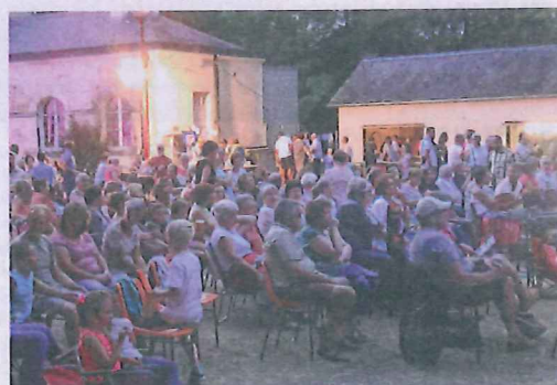
> BEAUCOUP DE MONDE AU CINÉMA PLEIN AIR. Vendredi soir, les jeunes de la Cdc Cœur de Brenne qui ont participé à des stages vidéo durant juillet, présentent leurs réalisations ainsi que le film « Qu'est-ce qu'on a fait au bon Dieu ».