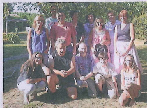
Les membres de l'Acel seront sur le pont pour Néons sur scène.

L'Acel fête ses 30 ans et présente la 3 e édition de son festival, Néons sur scène, les 14 et 15 août. Cette association née en 1985, à Néons, village de tradition théâtrale, présentera son travail de lecture, son festival Gaston-Couté et sa pièce de théâtre, Pierrot posthume , de Théophile Gauthier. Pour les représentations professionnelles, Néons accueillera trois